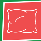
Dekbedden / (tuin)kussens