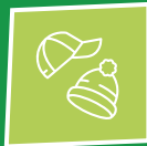
Hoeden / petten