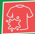
Natte / vuile kleding