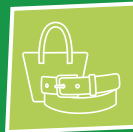
Tassen / accessoires