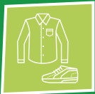
Kleding / schoenen